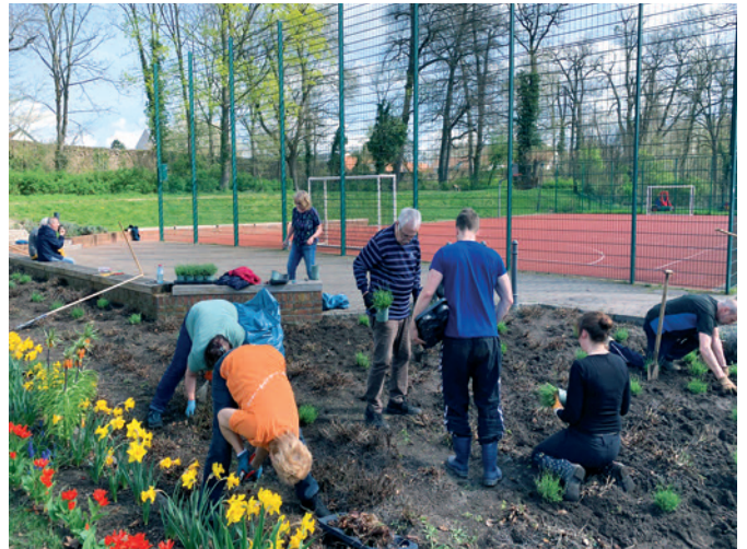
Frühjahrsputz im Ortsteil Altlandsberg

Dazu gehören der Heimatverein, der Freundeskreis Stadtkirche, die Fördergesellschaft Schlossgut, die Märkischen Löwen, der Club der Frauen, der Bibliotheksverein, Hand in Hand, der Feuerwehrförderverein und sicher noch einige Ungenannte. Bei allen Helfern möchte ich mich ganz